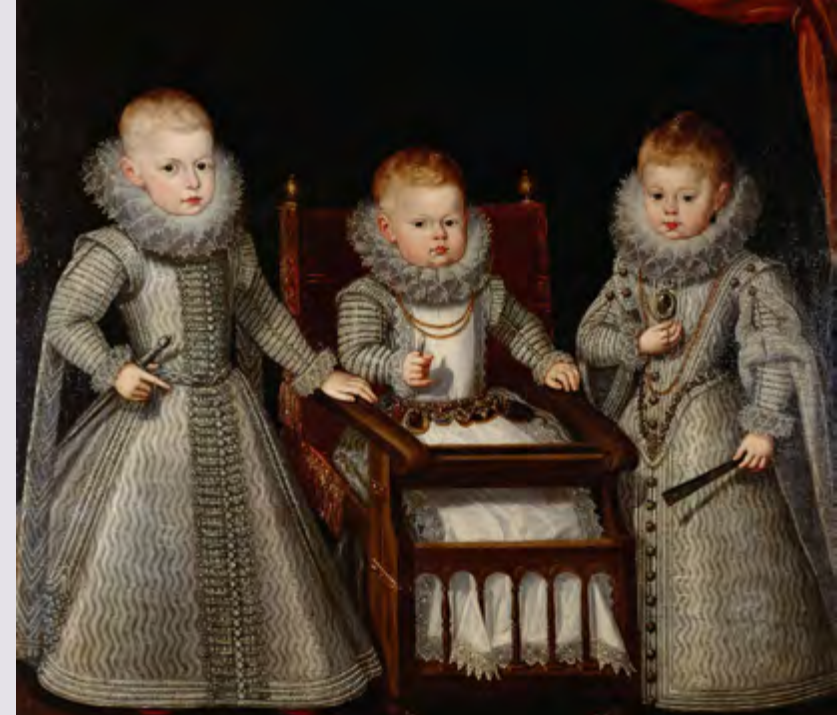
Bartolomé González, El cardenal-Infante Fernando, hijo del rey Felipe III, con sus hermanos el Infante Alfonso y la Infanta Margarita, 1612.