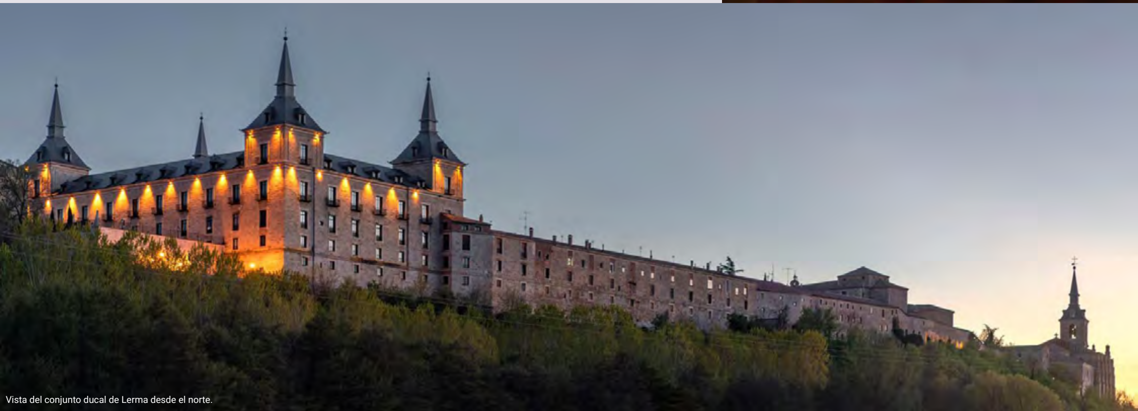
Vista del conjunto ducal de Lerma desde el norte.