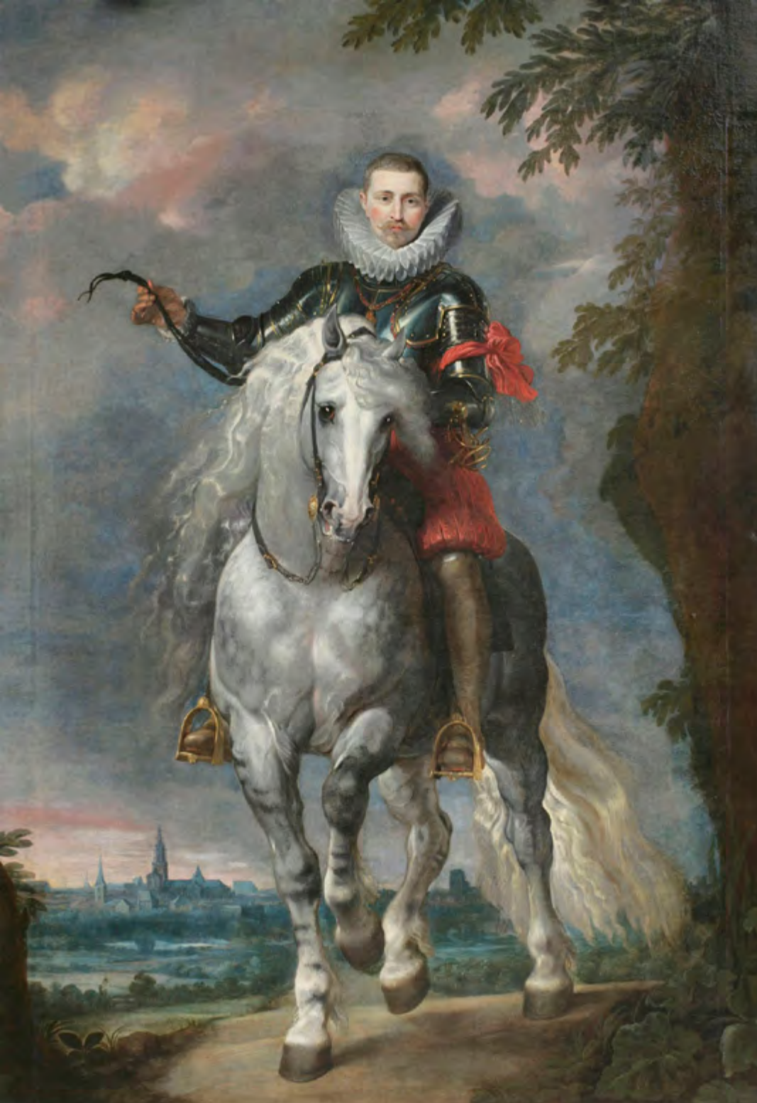
Pedro Pablo Rubens, Retrato ecuestre de Rodrigo Calderón, ca.1612 - 1615