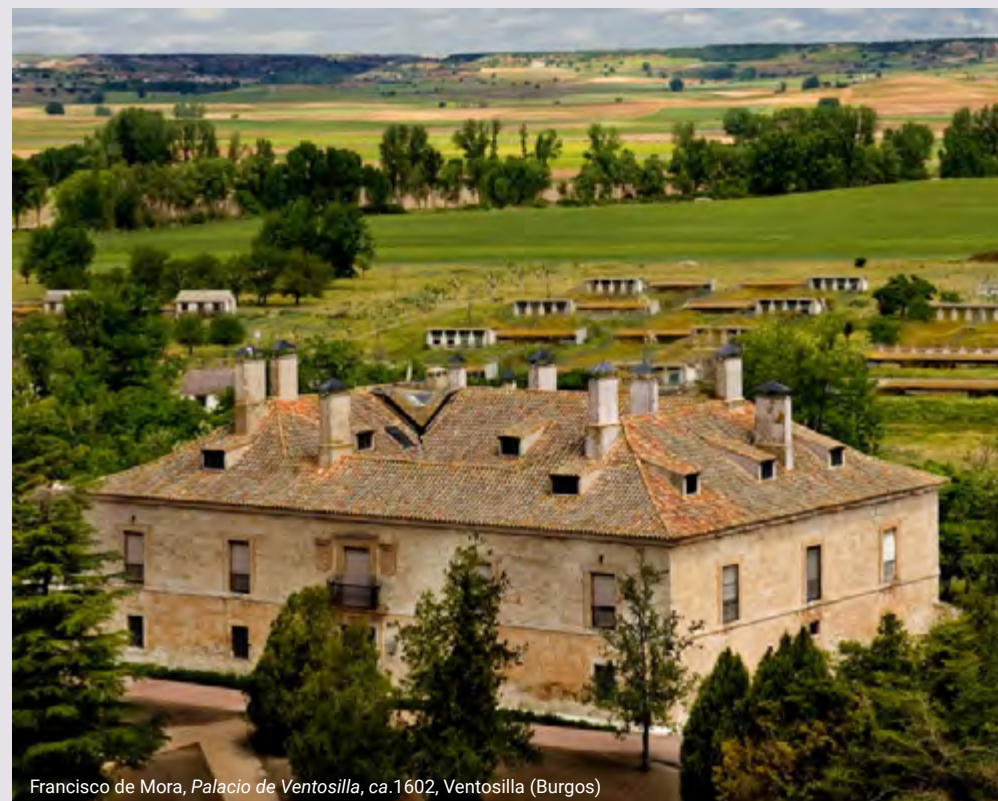
Francisco de Mora, Palacio de Ventosilla , ca.1602, Ventosilla (Burgos)