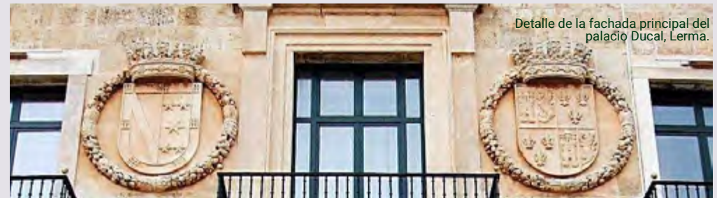
Detalle de la fachada principal del palacio Ducal, Lerma.