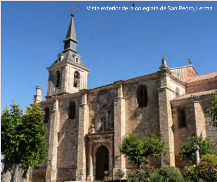
Vista exterior de la colegiata de San Pedro, Lerma.