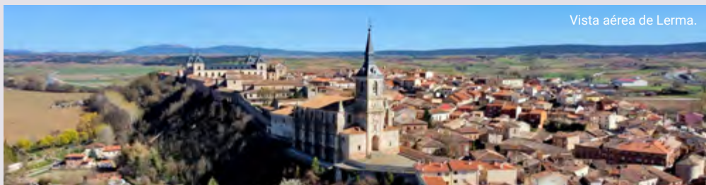
Vista aérea de Lerma.