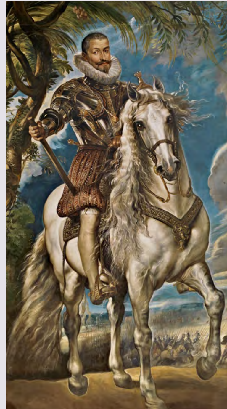
Pedro Pablo Rubens, Retrato ecuestre del duque de Lerma , 1603, (© Museo del Prado)