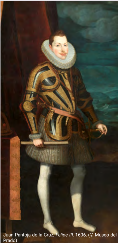
Juan Pantoja de la Cruz, Felipe III , 1606, (© Museo del Prado)

La complejidad de la vida cortesana encontró su mejor eco en la importancia concedida a la retórica visual como argumento de poder que, con múltiples implicaciones interrelacionadas en un continuum , siempre era cuidada y adquiría los tintes de extremosidad propia de un incipiente Barroco. Así, tanto los aspectos materiales como aquellos intangibles se tenían en cuenta en un delicado y meditado universo de formas y presencias. La imagen retratística, las galerías de antepasados, la presentación en los espacios públicos y privados, con singulares especificidades en las esferas femeninas, los ceremoniales y el aparato o las fiestas constituyen una elocuente muestra de las variadas posibilidades al alcance de las élites que utilizaron todos los recursos disponibles para dejar patente su condición y la posición conseguida en el juego cortesano.