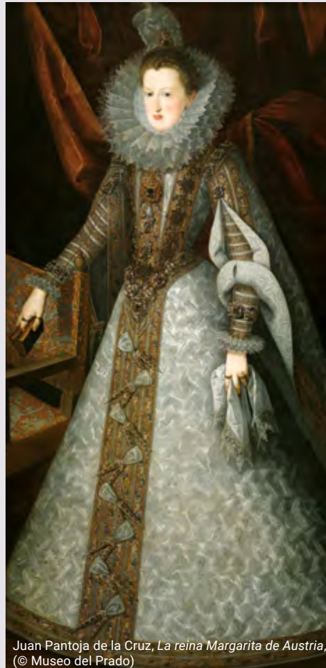
Juan Pantoja de la Cruz, La reina Margarita de Austria