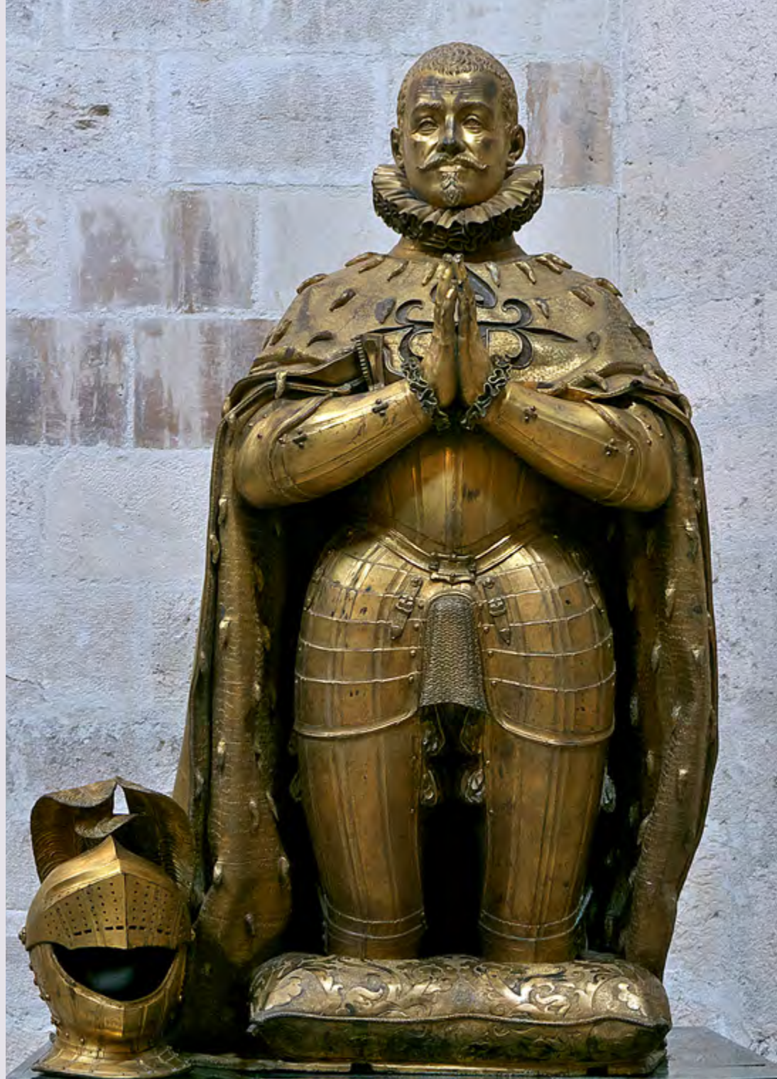
Pompeo Leoni, Estatua orante del duque de Lerma, 1601-1607, Capilla del Colegio de San Gregorio, Valladolid

Todo ello estuvo respaldado por dos estrategias complementarias. Por una parte, el diseño de una teoría política encaminada a justificar la posición privilegiada de don Francisco, es decir, la privanza, puesto que Felipe III había roto con la tradición anterior al demostrar, públicamente, su predilección por una única persona.