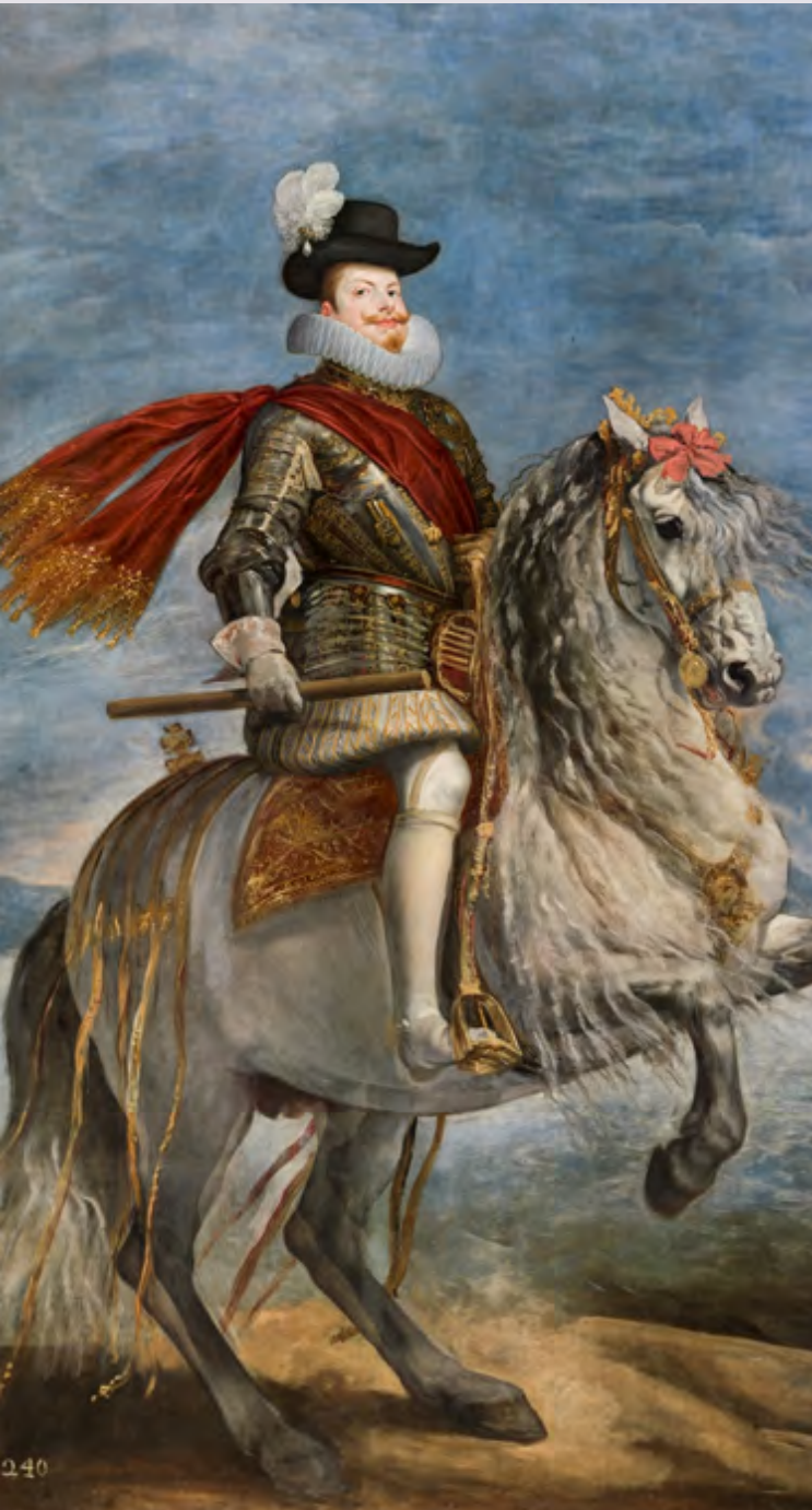
Diego de Velázquez y otros, Felipe III, a caballo , ca. 1635, (©Museo Del Prado)