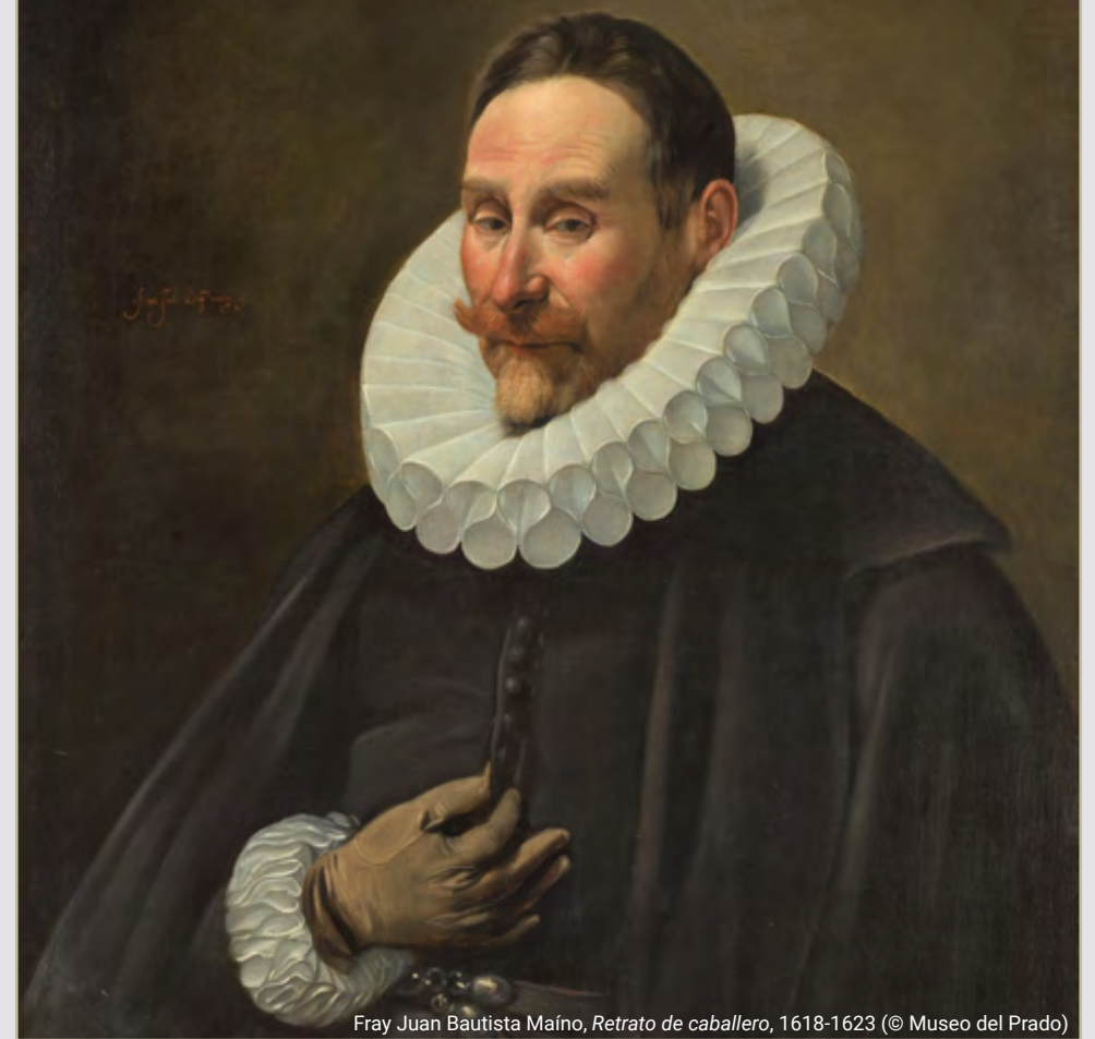
Fray Juan Bautista Maino, Retrato de caballero, 1618-1623