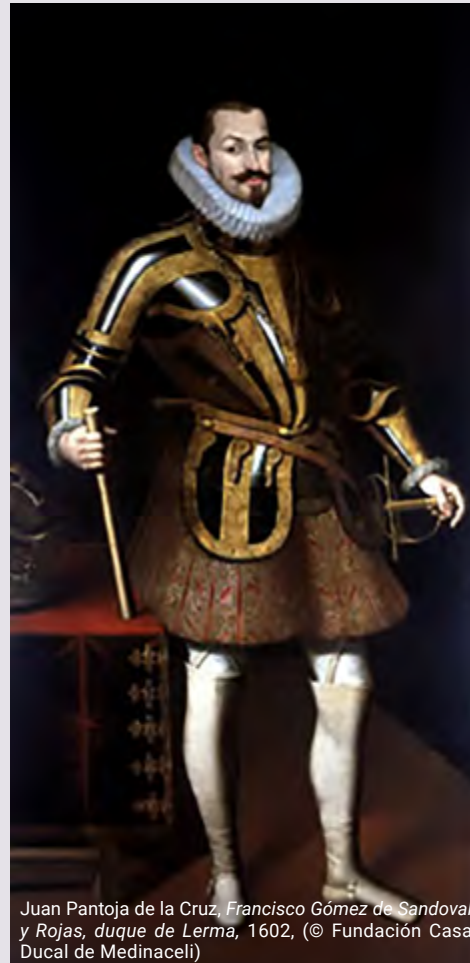
Juan Pantoja de la Cruz, Francisco Gómez de Sandoval y Rojas, duque de Lerma, 1602